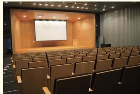
【2階・カンファレンスホール】